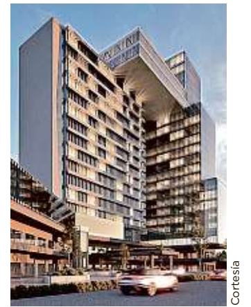
El proyecto costará 850 millones de pesos y concluirá en 2025.

Trejo indicó que uno de los principales retos para atender a esos extranjeros será dotar de conectividad de internet alámbrica e inalámbrica, así como que el mercado residencial se adapte a las necesidades de hábitos y costumbres de usos de la vivienda y temas de seguridad que demandan.