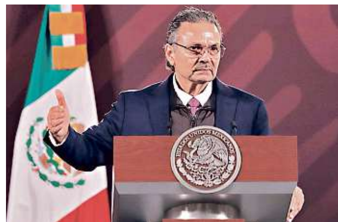
Octavio Romero, director general de Petróleos Mexicanos.

“Pero estamos buscando levantar 600 mil dólares a una valuación total de 4 millones de dólares”, puntualizó el profesionista.